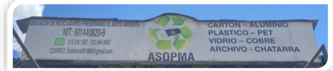
(Imagen interna del predio ubicado en la Carrera 81d No. 40d – 26 sur)