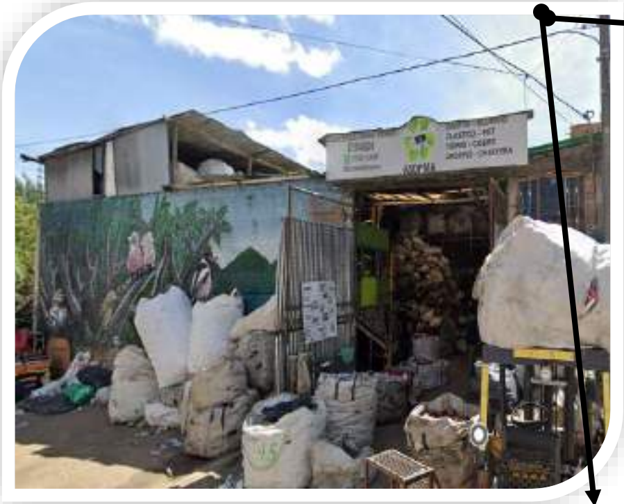
(Imagen fachada del predio ubicado en la Carrera 81d No. 40d – 26 sur)